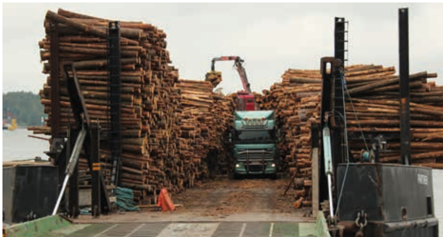
Virkeslastning i Korpo i Åbolands skärgård.