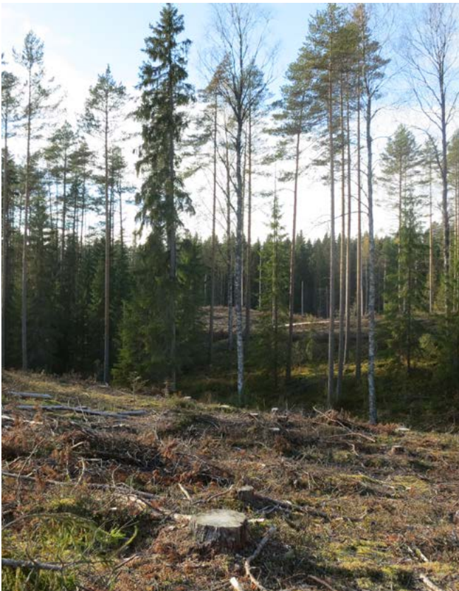
Metsäsertifiointissa edellytetään jättämään säästöpuita ja suojavöhykkeet vesistöjen varsille.

Metsänhoidon suositukset ja talousmetsien luonnonhoito tarjoavat metsänomistajille tietoa kestävä metsänhoidon perusteista ja erilaisia vaihtoehtoja metsien käsittelyyn. Suositukset perustuvat tutkimustietoon. Suositusten avulla maanomistaja voi määrittää tavoitteidensa mukaisen tavan hoitaa metsiään. Lisätietoa metsänhoitosuosituksista löytyy www.metsanhoitosuosituks.fi .