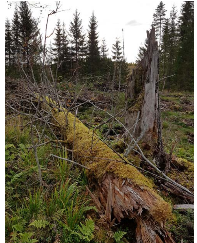
Sertifiointi edellyttää säästämään lahopuita ja välttämään niiden vaurioittamista.